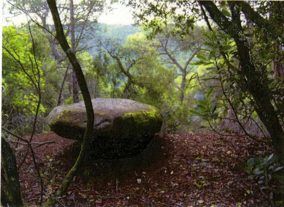
Vista de la base del menhir tallada parcialment.

Els grups humans que construeixen dolmens i aixequen menhirs formen l'anomenada societat megalítica . En el cas de les nostres comarques, això s'esdevé a partir del Neolític final, quan s'ocupa de nou la muntanya i es realitza un ritual funerari basat en enterraments col·lectius d'inhumació del tipus galeries catalanes, que perduraran fins a l'etapa anomenada Calcolític. En aquesta època apareixen els primers objectes de coure, or i plata que conviuen encara amb els vells instruments de pedra. Tot aquest procés se situa durant el tercer mil·lenni abans de la nostra era.