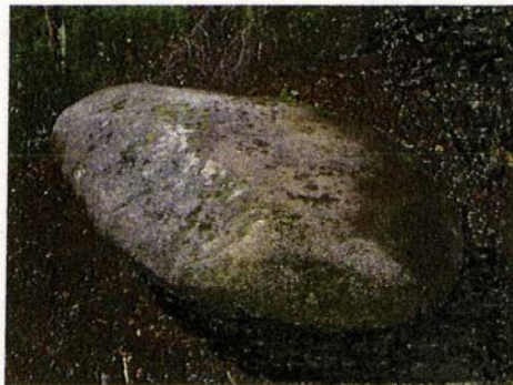
A la cara superior s'hi veu clarament el treball d'abrassió i pulimentat que donen el resultat final a la peça.

Per aquesta raó cal anar amb cautela a l'hora de classificar una pedra dreta com a menhir prehistòric. La millor manera de determinar-ne l'antiguitat és la confirmació mitjançant una excavació arqueològica, però també hi poden ajudar la presència de gravats o inscultures, que es conegui d'antic, la situació dins una zona dolmènica, la